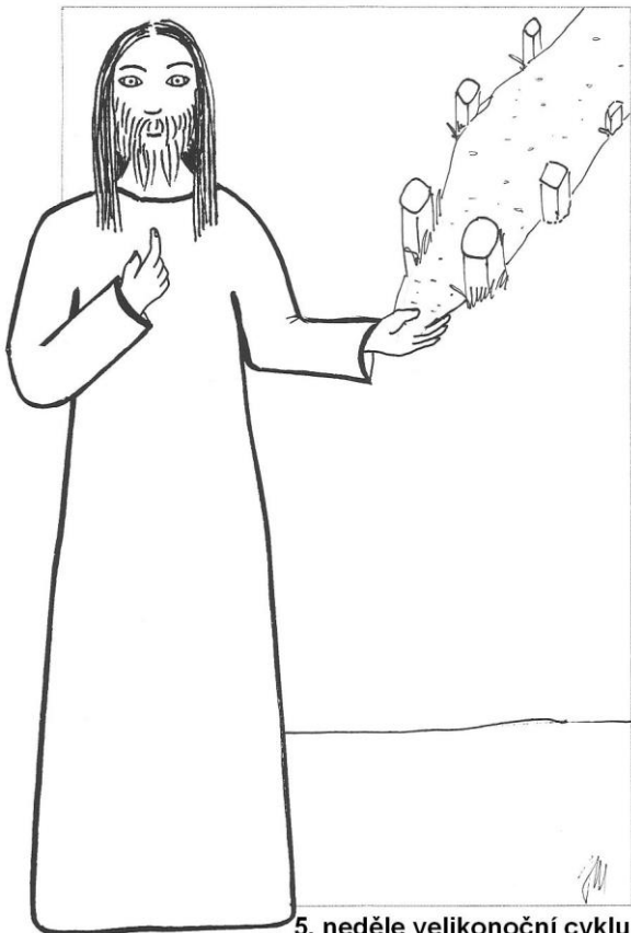
5. neděle velikonoční cyklu A Jan 14,1-12