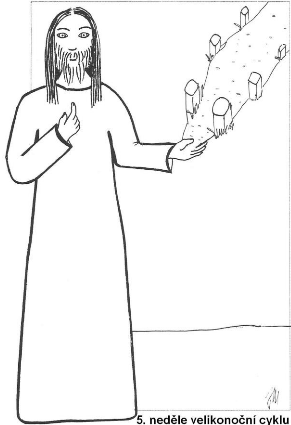
5. neděle velikonoční cyklu A Jan 14,1-12