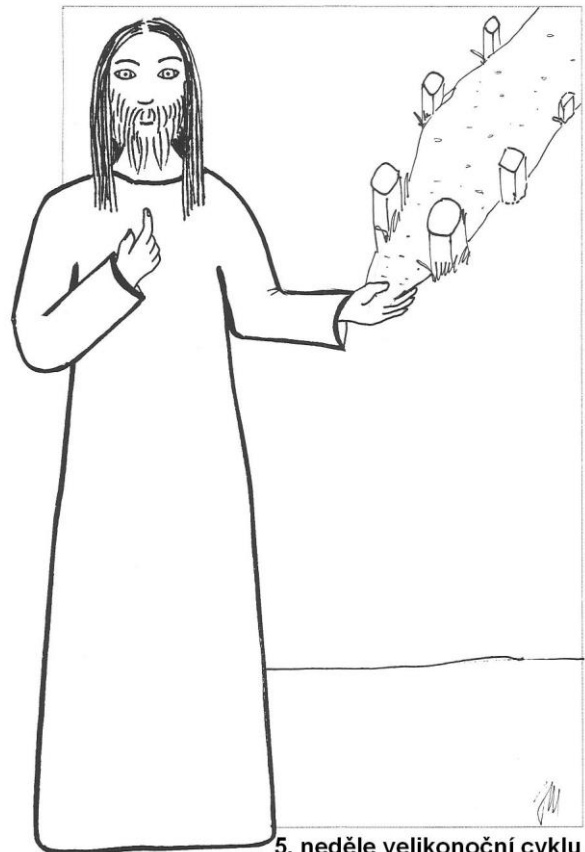
5. neděle velikonoční cyklu A Jan 14,1-12