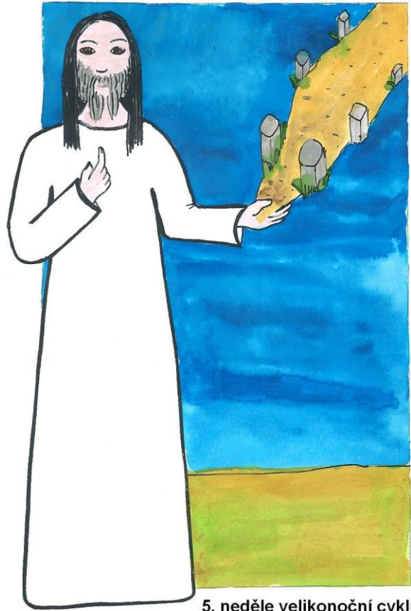
5. neděle velikonoční cyklu A Jan 14,1-12